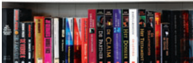
«Als er een nieuwe Aspe uitkomt, hol ik naar de winkel om hem te kopen. Ik ben dol op detectives.»